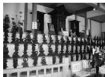
【天明鑄物 佐野百観音】 宗教法人台元寺・佐野百観音