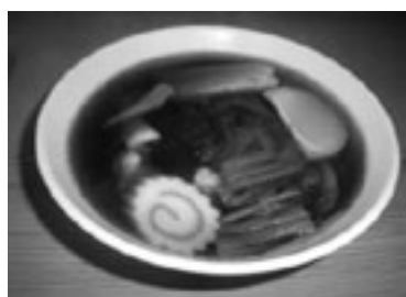
【耳うどん】 そば処勝味屋