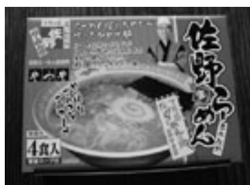
【おみやげ麺 佐野らーめん】 佐野やつや