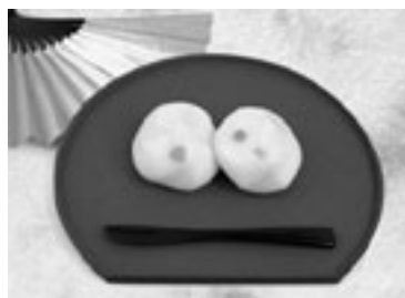
【しんこまんじゅう】 田沼菓子パン組合