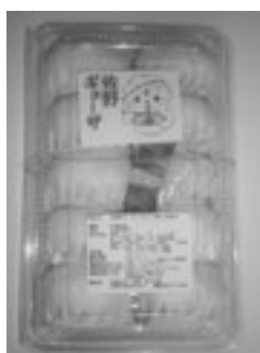
【佐野餃子】 有限会社 永華