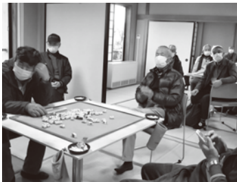
▲茂呂山クラブの活動の様子