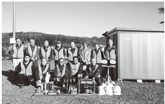
▲犬伏下町防災会の皆さん