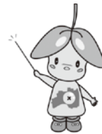
本宮市イメージキャラクター まゆみちゃん

佐野市から車で約2時間。福島県のほぼ真ん中に本宮市はあります。家族でのお出かけスポットも多数あり、市内宿泊+ SNS投稿で宿泊費の助成を受けることもできます。