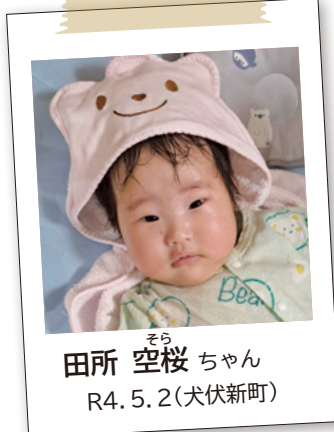
そら 田所 空桜 ちゃん R4. 5. 2 (犬伏新町)