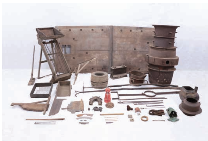
▲主な天明鋳物生産用具および製品

今回指定される1556点は「天明鋳物伝承保存会」と佐野市が協力し、その調査と収集を進めてきたもので、生産の各工程で使用された一連の用具が揃っており、主要な製品もあわせて収集されています。