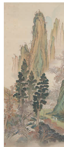
▲荒木寛友《上州妙義中嶽真景図》当館寄託▲