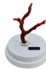
▲ベニサンゴ (地中海産)