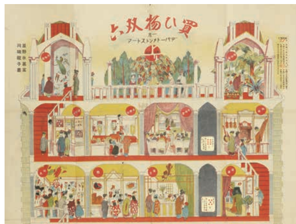
▲大正時代のすごろく