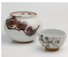
▲(左) 椿文水指、(右) 椿文茶盃