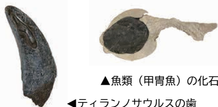
▲魚類(甲冑魚)の化石

▶休館情報 1月3日(金)まで、1月14日(火)~17日(金) ※13日(月祝)は開館