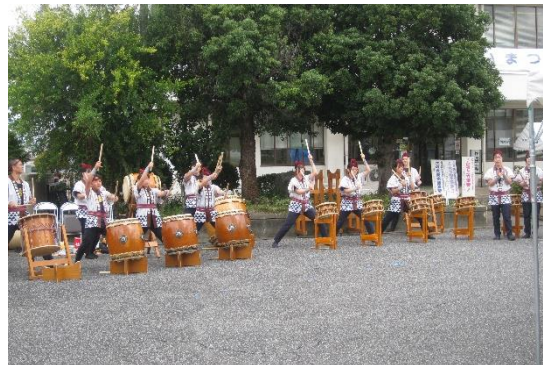
さの秀郷太鼓保存会の演奏