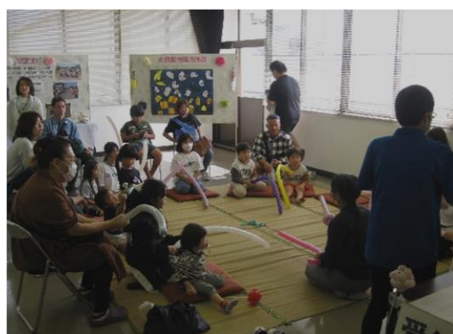
バルーンアート体験の様子