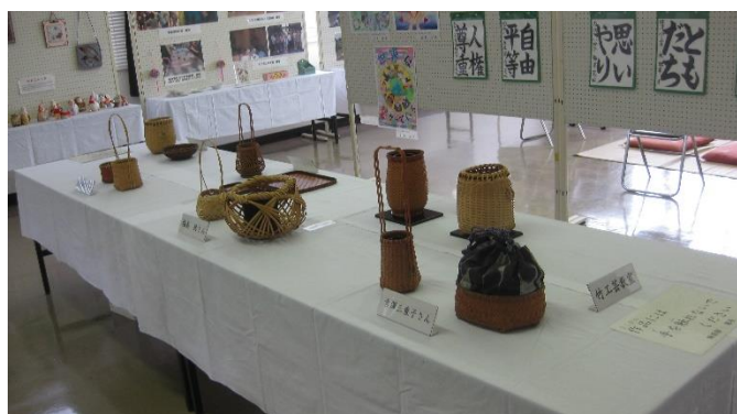
館内展示会場の様子