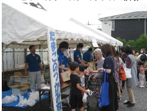
たまごのつかみ取り