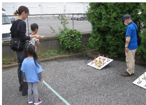
輪投げを楽しむ親子