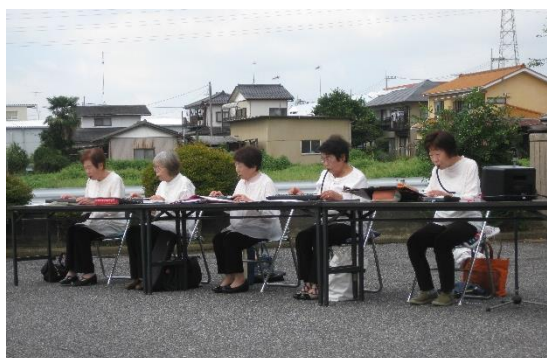
ピアノカサークル フレンスの演奏