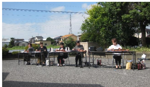
大正琴サークル 秋桜の演奏