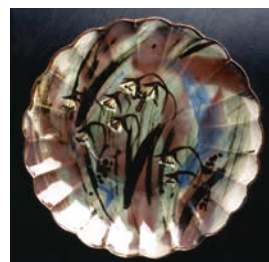
▲かたくり文輪花大皿