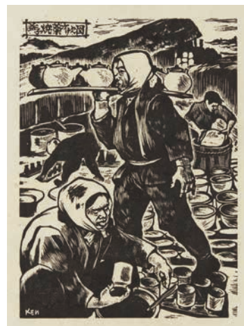
▲鈴木賢二《益子焼葉がけ之図》 1956年、栃木県立美術館所蔵

▶会期 1月24日(土)～ 3月8日(日) ▶休館情報 2月12日(木)、 2月24日(火) ※2月23日(月祝) は開館