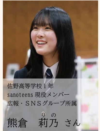
佐野高等学校 1 年 sanoteens 現役メンバー 広報・SNS グループ所属

地域活動に全力で取り組んだ sanoteens での日々。その経験は、高校卒業後の進路や人生観にどのような影響を与えたのでしょうか。二十歳を迎えた卒業生をゲストに迎え、現役メンバーがインタビュー！