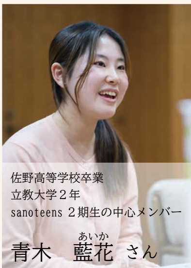
佐野高等学校卒業 立教大学 2 年 sanoteens 2 期生の中心メンバー

青木さん 印象深いのは、佐野サービスエリアに置いてあるハイウェイスタンプのデザイン