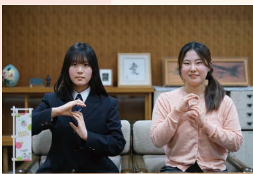
▲ sanoteens メンバー考案のポーズで撮影しました