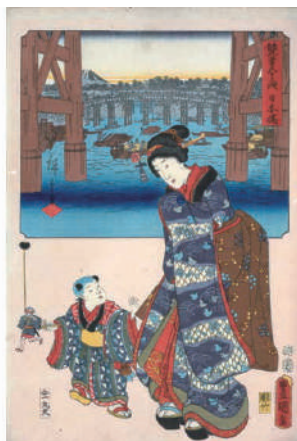
▲歌川国貞・歌川広重《双筆五十三次》より「日本橋」1854年 寄託(吉澤コレクション)

▶無料開館 6月14日(日) 栃木県民の日 作品鑑賞会(14:00~)を実施します。