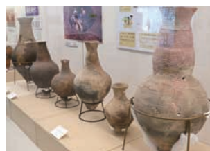
◀市指定文化財 出流原遺跡出土 弥生土器