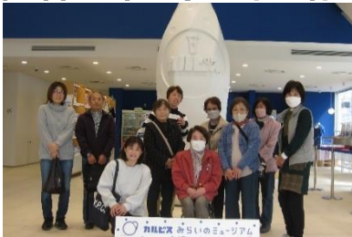
カルピス工場見学（令和8年3月）