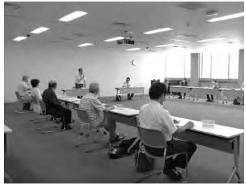
▲佐野市まち・ひと・しごと創生懇談会の様子

会議では、昨年実施した国勢調査の速報値における本市の人口が116,220人で、前回の国勢調査(平成27年)に比べ、2,699人の減少となっているものの、市が令和2年に策定した佐野市人口ビジョン改訂版における目標人口を上回っていること、令和2年の人口動態では180人の転入超過となった一方で、出生数の減少などを起因とした自然減が続いていること、などの報告を行いました。