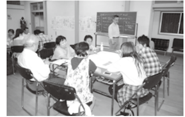
▲地域おこしの様子（動画より抜粋）

おめ・叙勲・褒章の受章、 褒章の受章、 叙勲・褒章の受章、 おめでとうございます。