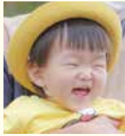
りく 陸ちゃん 令和2年7月生

※次回の「アイドル登場」の掲載は2月号です。次号では「とどけ夢未来へ」を掲載します