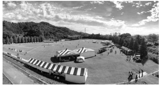
▲佐野市国際クリケット場(SICG)

佐野市国際クリケット場(SICG)ではクリケットのほか、キッズサッカーやキックバイクイベントなどの開催を予定しています。皆さんにさまざまな用途で活用していただき、「居心地の良い空間、佐野市国際コミュニティグラウンド-SICG-」として、この場所をさらに魅力のある場所として発展させていきます。