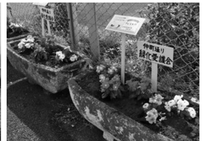
▲花いっぱい運動の様子