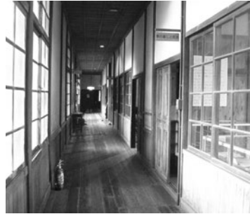
▲木のぬくもりたっぷりの校舎の中

校舎の中に入ると、当時のままの木のぬくもりが感じられました。「暮らしと民具」「仕事と民具」「防災と民具」「交通・交易と民具」が展示されていました。今も使われているような食器、今と昔では形が変わったアイロンや湯たんぼ、今では使われなくなり昔の時代のドラマで見るとような道具、機械化される前の農機具や馬の道具など、町内から集められた貴重な郷土資料がありました。この三好館は、毎月第2・第4日曜日に開館していて、その日は近隣の方たちが交代で鍵を開ける当番になっているそうです。地域の方に支えられて大切に残されている三好館で昔の生活に思いをはせることができました。