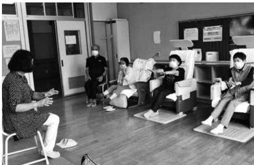
▲健康体操(フレイル予防)の様子