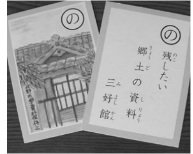
▲佐野かるたの一句