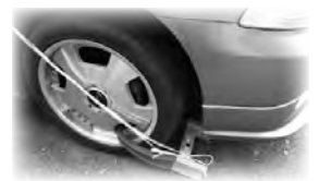
▲差し押さえの様子

【差押処分】滞納されている方の財産（不動産、預貯金、生命保険、給与、自動車など）の差し押さえを行います。差し押さえ後も納付にならない場合は、差し押さえ財産の公売・取り立てを行い市税に充当します。