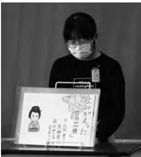
▲読み聞かせをする出流原小学校の6年生