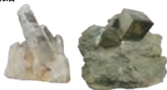
▲日本産水晶 ▲スペイン産黄鉄鉱