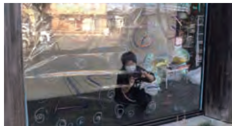
▲アートイベント準備の様子

佐野市地域おこし協力隊 熱気球パイロット 昨年9月に豪州で開催された「第5回FAI熱気球女性世界選手権2023」に参加