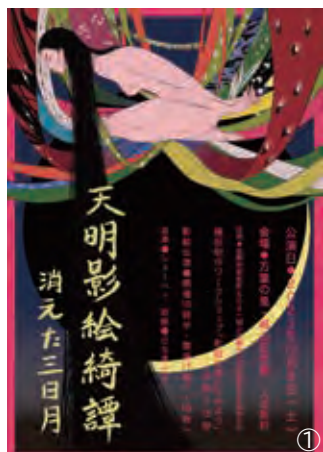
①公演チラシ ②当日の様子