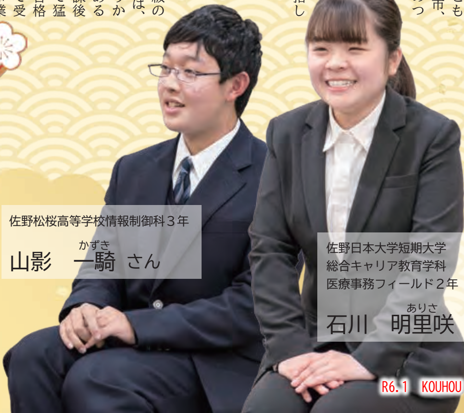
佐野松桜高等学校情報制御科3年

学校を卒業して地元に残るか出るか、進学するか働くか、いろいろな選択肢があると思います。住み続けたい地域を作るには、幼い頃から職業についての意識を持つことが非常に重要だと