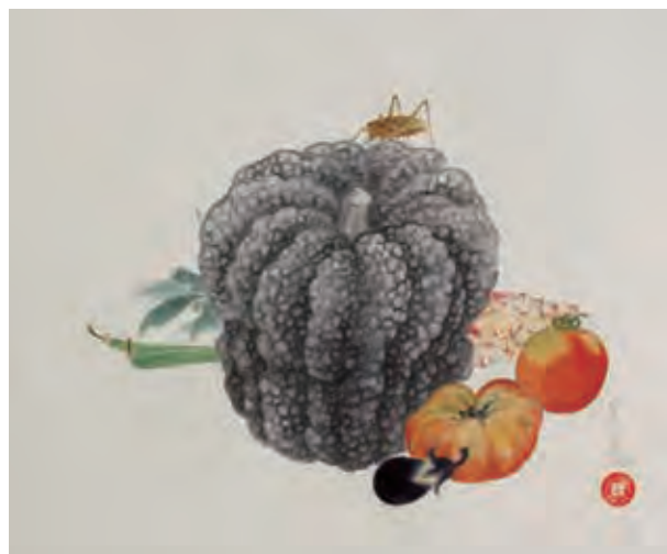
▲石川寒巖《菜果図》栃木県立美術館所蔵