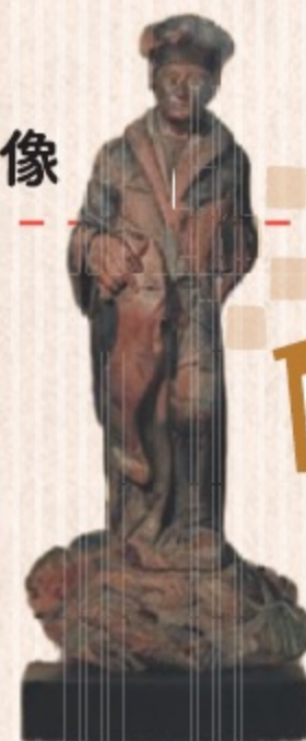
国指定 重要文化財

慶長5(1600)年豊後国(大分県)に漂着したリーフデ号の船尾に立てられていたもので、オランダの神学家・啓蒙思想家エラスムス(1467～1536年)の像。我が国の対外交渉史の上で貴重な資料です。