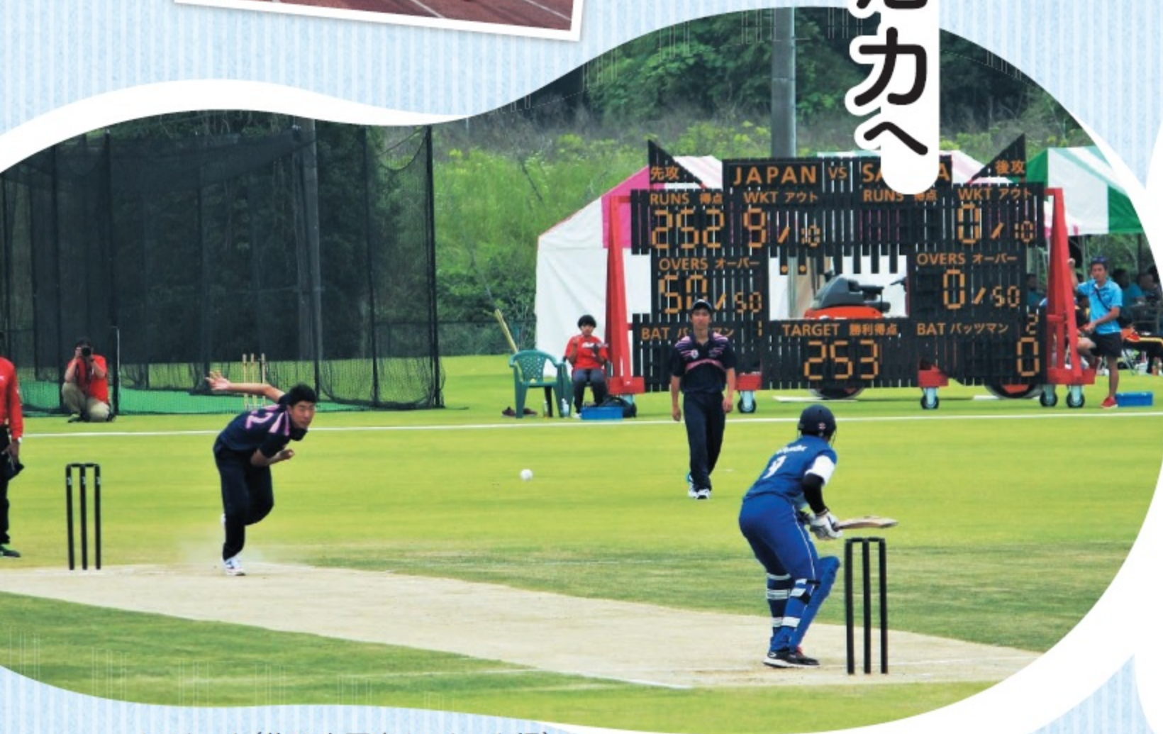
クリケット(佐野市国際クリケット場)