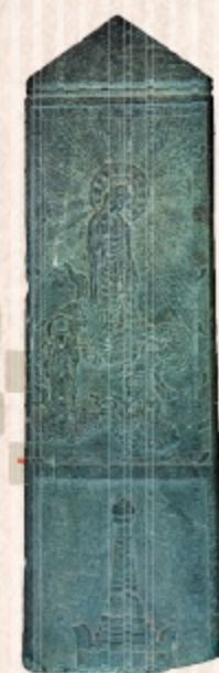
国認定 重要美術品

堀米町地内で出土した板碑で、高さ151cm、重さ90kgの緑泥片岩製のもの。阿弥陀如来を中心に脇侍を配し、飛雲に立つ「来迎図」が彫刻されています。