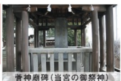
菅神廟碑(当宮の御祭神)