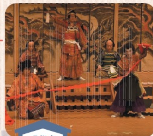
県指定 無形民俗 文化財

江戸時代後期に歌舞伎役者関三郎により伝えられ、葛生北部の牧地区で傳承されている地芝居です。