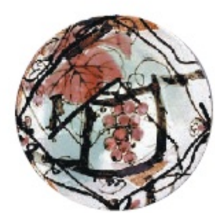
人間国宝 田村耕一 作品