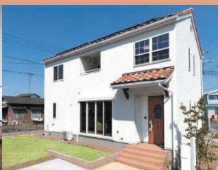
商品名：レクア ナチュラルカフェスタイル