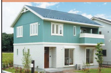
商品名：レシビエ ノルディックスタイル