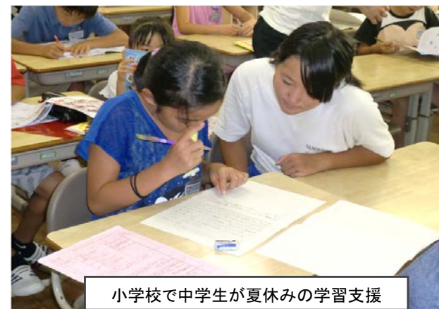
小学校で中学生が夏休みの学習支援