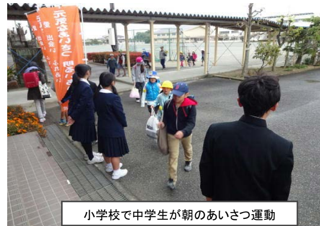
小学校で中学生が朝のあいさつ運動