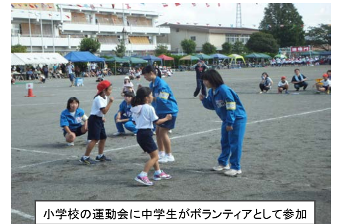
小学校の運動会に中学生がボランティアとして参加