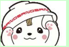
佐野フレンドキャラクター さのまる