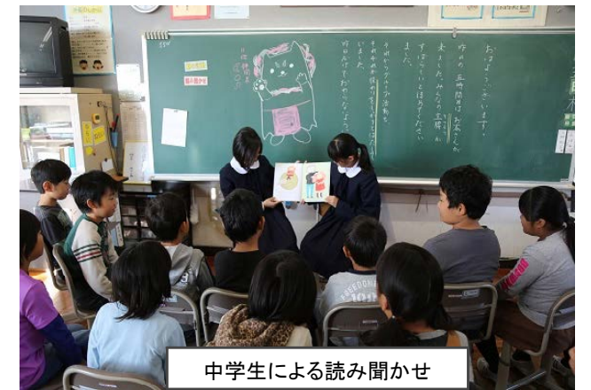
中学生による読み聞かせ