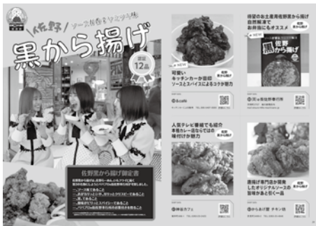
▲佐野黒から揚げ掲載ページ