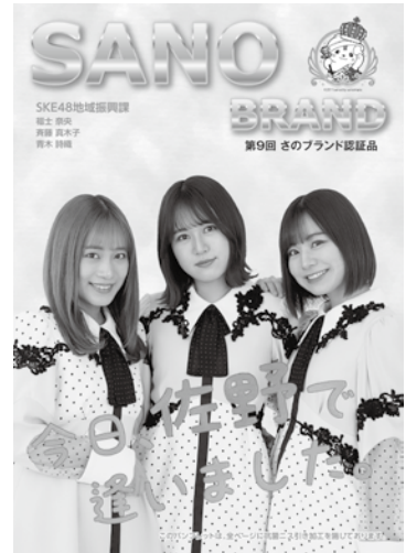
▲パンフレット表紙