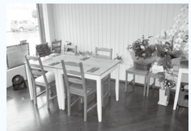
▲空き店舗を改装し新規開店した 店内の様子