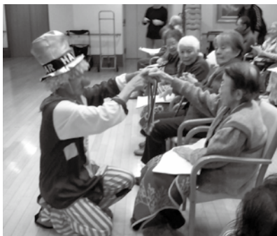
▲ピエロマジックの様子