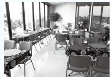
▲チャレンジショップ飲食店 専門フロアの様子