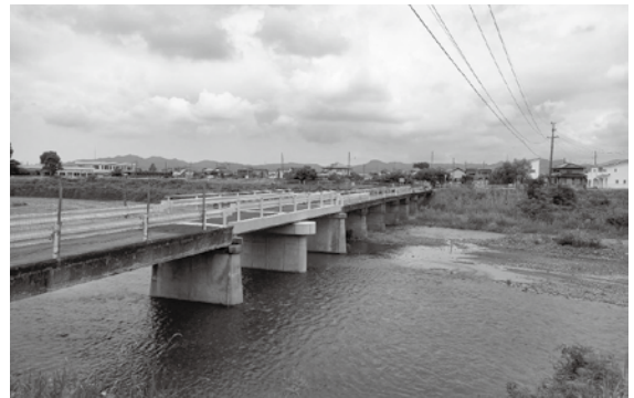
▲復旧完了後の様子