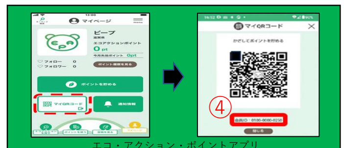
エコ・アクション・ポイントアプリ