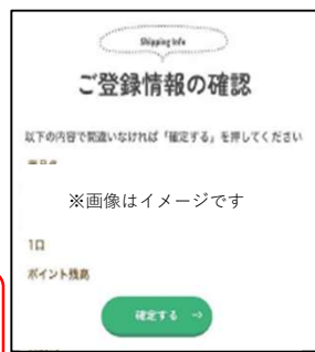
内容の確認後「確定する」