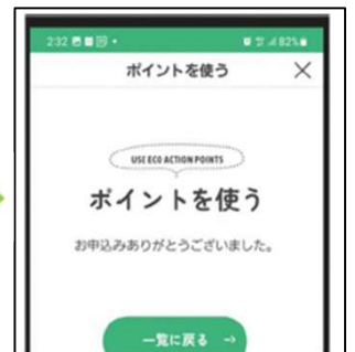
次に、③の手順に進みます。