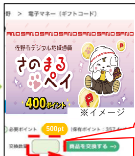
交換数量を入力し、「商品を交換する」