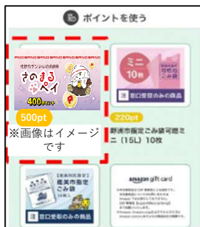
さのまるペイを選択

エコ・アクション・ポイント500ptを、さのまるペイポイント400ptに交換できます。