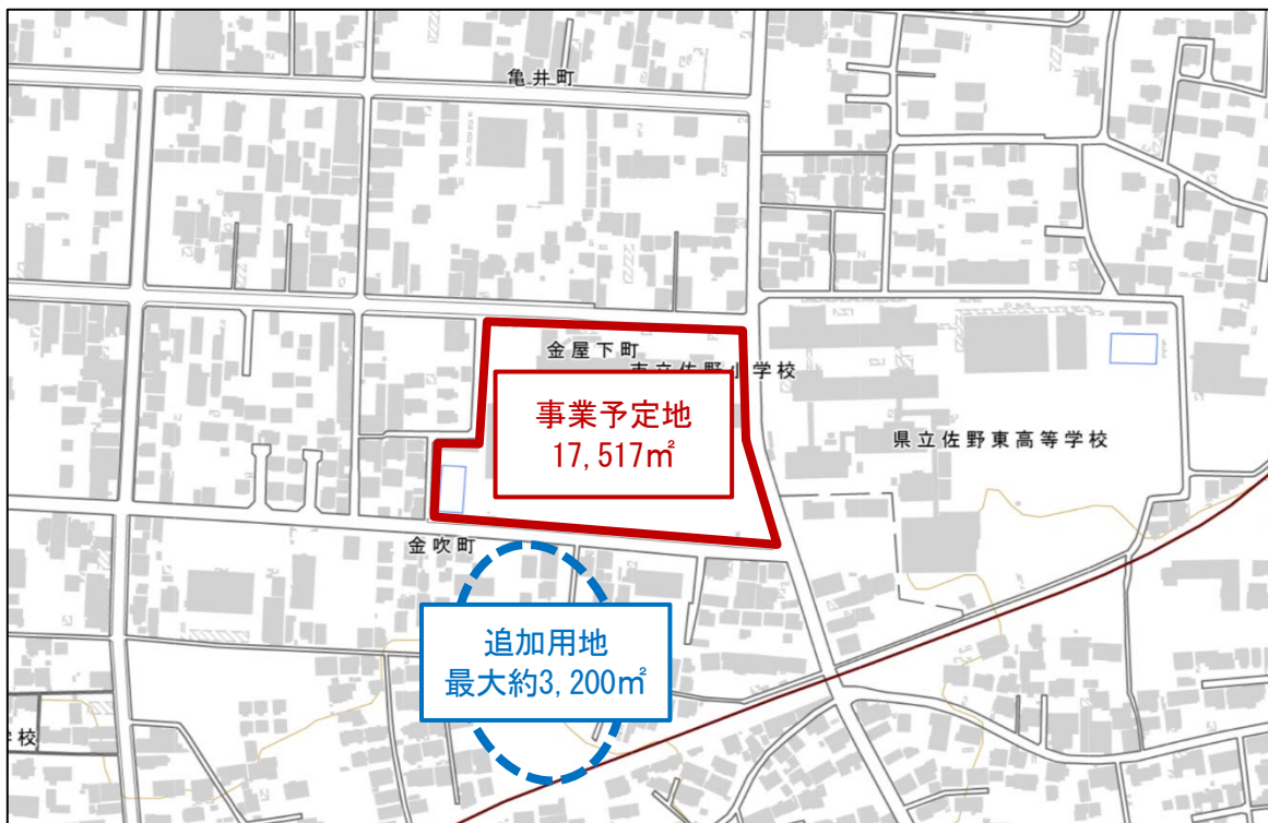
図1 事業予定地の位置図