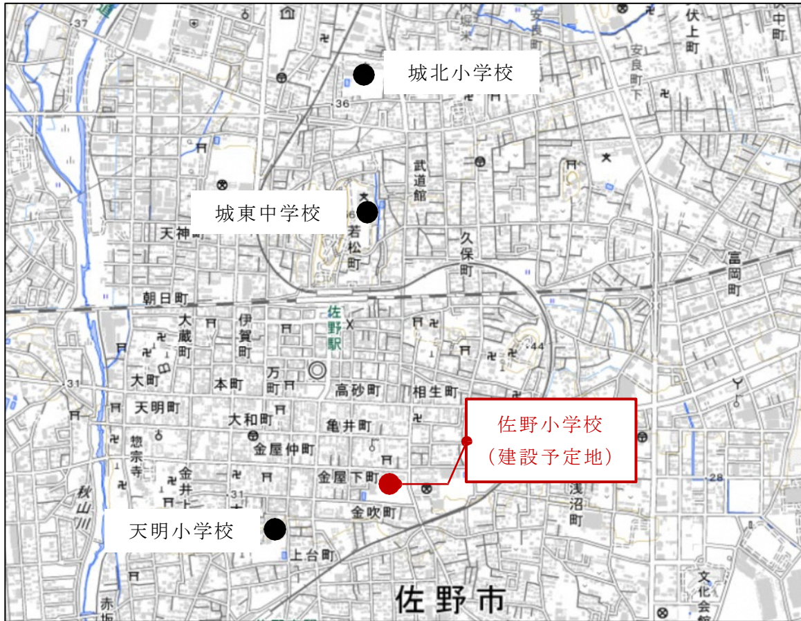
図2 事業対象の小・中学校位置図