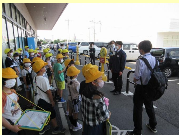
▲スーパーマーケット見学