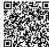
(佐野市)固定資産税に関する Q&A

A 会社の事務所を住宅用建物として使う場合、または住宅用建物を会社の事務所として使う場合など、建物の利用状況に変更がある場合、現地を確認する必要がありますのでご連絡ください。