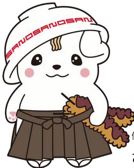
佐野ブランドキャラクター さのまる