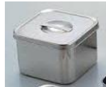
ふた付きのステンレス容器がおすすめ