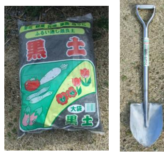
黒土やスコップはホームセンター等でお買い求めいただけます

3、4日生ごみをため置きの必要があります。三角コーナーでは、虫や臭いが発生し不衛生なので、ステンレス製のふた月の容器のものなら臭いにつきにくく最適です。