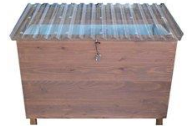
ベランダやテラスに置く底があるタイプです

「キエーロ」は、土と太陽と風のを借りて生ごみを分解・消滅させるための生ごみ処理容器です。土の中に生ごみを埋めるだけで土壌中のバクテリアが生ごみを分解します。夏場は1週間、冬場は2、3週間で生ごみは消滅します。