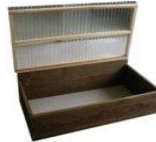
土の上に直接置く底がないタイプです