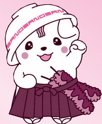
佐野ブランドキャラクターさのまる

タックルやトライなど激しいスポーツというイメージがありましたが、「もっとラグビーを知ってもらいたい」「けがはがんばった勲章です」とはにかみながら話す笑顔をみて、将来の女子ラグビーが楽しみになりました。