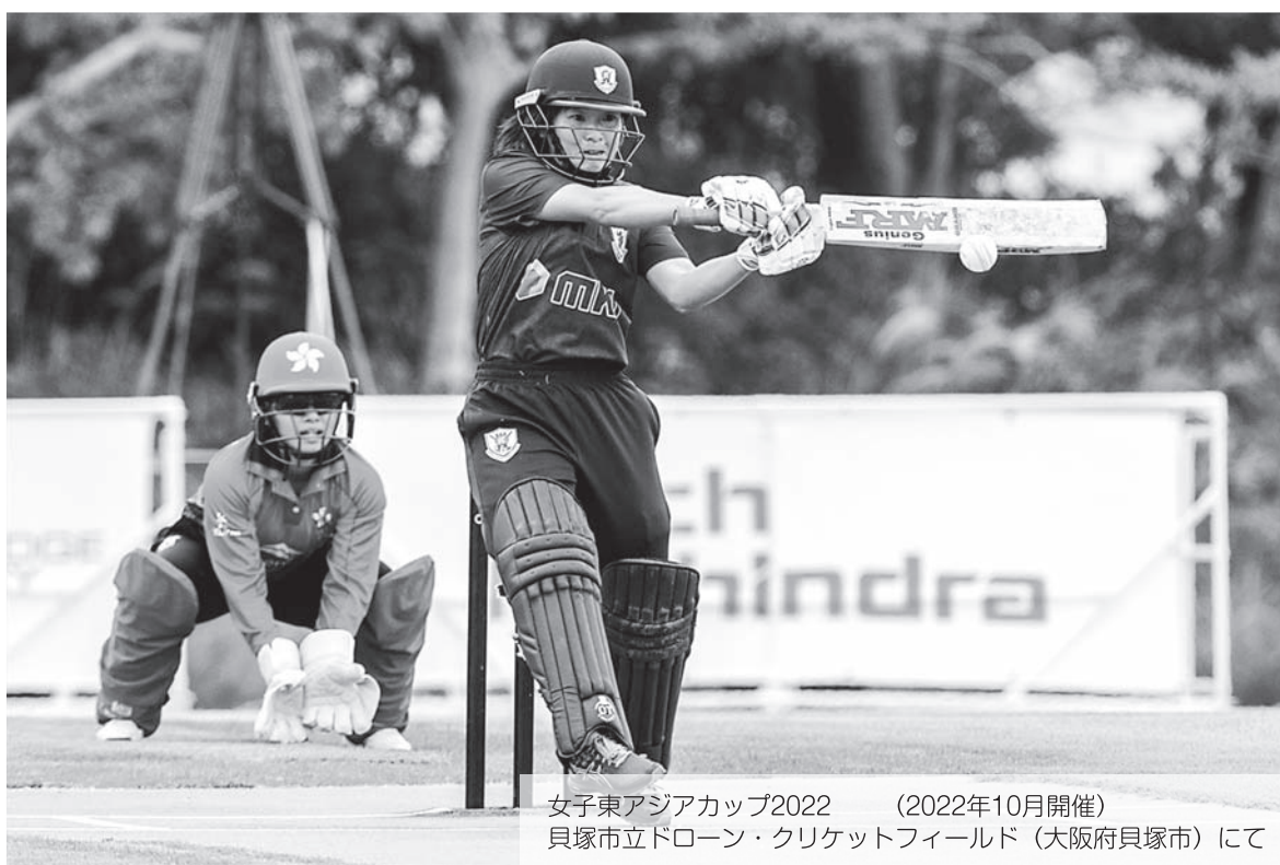
女子東アジアカップ2022 (2022年10月開催) 貝塚市立ドローン・クリケットフィールド (大阪府貝塚市) にて