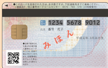
マイナンバーカード裏面