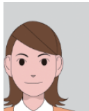
顔の位置が片寄っている