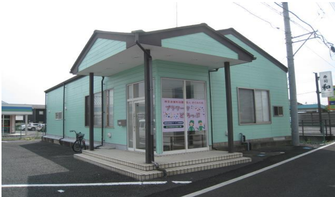
☆プラワークどろっぷ

施設外就労場所：福田工業株式会社様・株式会社鹿沼梱包ロジスティクス様(佐野市多田町 161)、その他