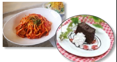
人気のナポリタンとデザートメニューのガトーショコラ