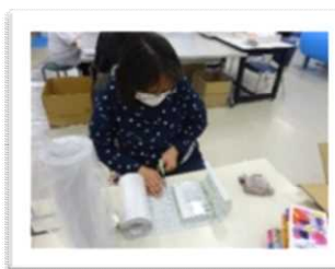
ブックカバー付け