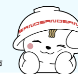
佐野ブランドキャラクターさのまる ©佐野市

乳児家庭全戸訪問(赤ちゃん訪問)時に面談、アンケートに回答していただいた方に支給