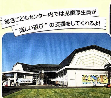
総合こどもセンター内では児童厚生員が“楽しい遊び”の支援をしてくれるよ!