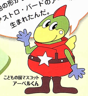
こどもの国マスコット アーベルくん

面積は4.4ha。 敷地の形は、鳥が翼を広げたようだよ。 敷地の形からマスコットである僕、アストロ・バードのアーベルが生まれたんだ。