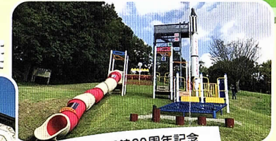
こどもの国 開館20周年記念 複合遊具で遊んじゃおう!