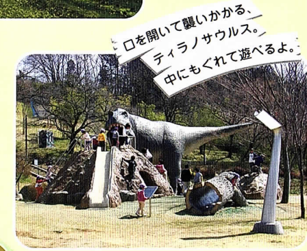
口を開いて襲いかかる、ティラノサウルス。中にもぐれて遊べるよ。