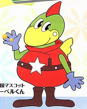
こどもの国マスコット アーベルくん