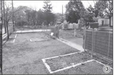
①豊代町(市道大久保下川線) ②菊沢川 ③吉澤記念美術館 ④水木町(市道桧内線) ⑤豊代町(常盤橋) ⑥林道(長谷場閑馬線) ⑦赤見運動公園プール駐車場 ⑧栄公園野球場