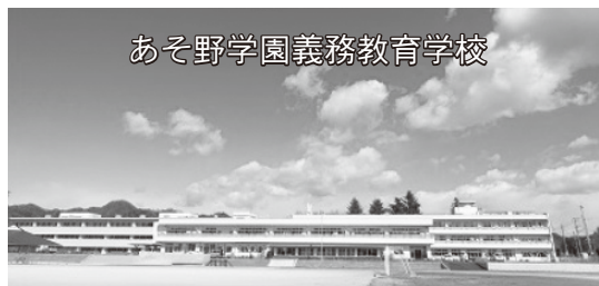
【拠点校】田沼西中学校 【児童生徒数】826人(令和2年度開校時)