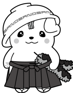
単色(グレースケール)

・SANO : M96% Y94% ・前髪 : C12% M18% Y53% ・ホッパ : C7% M42% Y22% ・袴 : C63% M65% Y74% K20%