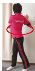
上体ひねり(左右・斜め上)