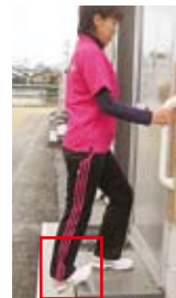
アキレス腱伸ばし