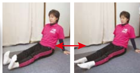
足首の曲げ伸ばし

じっとしていると足腰の血行が悪くなり、疲労や腰痛、むくみや冷えにつながります。意識して脚の血流改善を積極的に行いましょう!