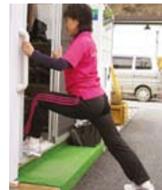
股関節とふくらはぎ