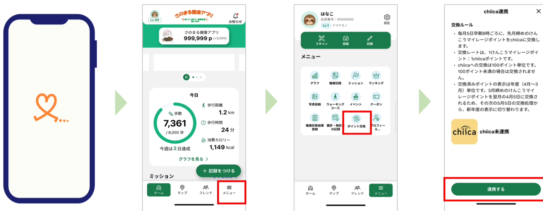
けんこうマイレージアプリを起動する

※プロフィール登録を事前に行ってください。ご不明点は下部問合せ先へご連絡ください。