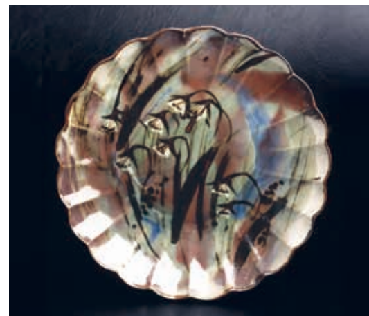
かたくり文輪花皿