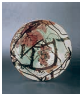
鉄絵銅彩葡萄文陶板