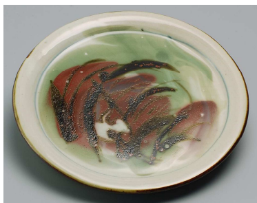
そうげんにさぎもんとうばん 草原に鷺文陶板