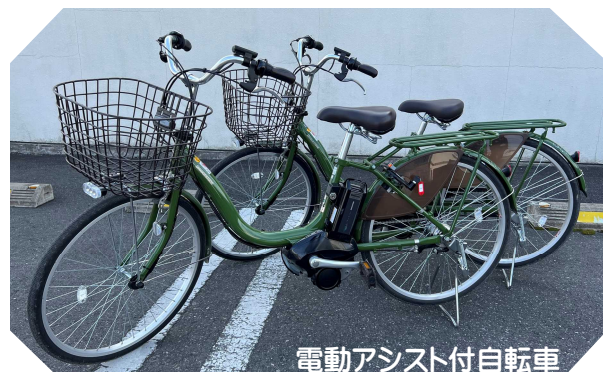
電動アシスト付自転車