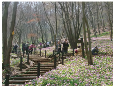
かたくりの里ハイキングコース