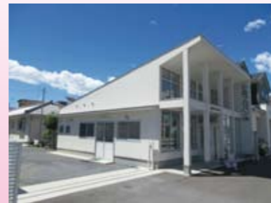
『小島プロパン株式会社』