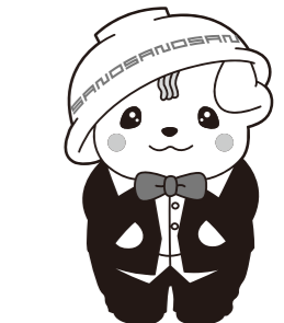
佐野ブランドキャラクター さのまる