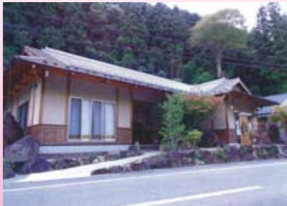
『手打ちそば かみやま』