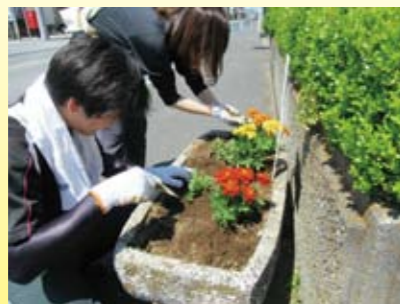
『仲町通り緑化愛護会』